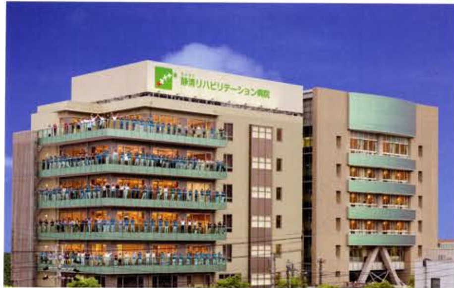
▲写真は本年6月8日の病院新設時にスタッフ全員で撮影したものです。

ビリテーション病院」で治療・リハビリを始めたとします。そして2ヵ月後に退院、受け入れ先の問題から介護老人保健施設「エスコートタウン」で、もう1ヶ月のリハビリをし、在宅介護を行うことになったとします。急性期病院からの骨折の治療状況や経過情報は、「静岡リハビリテ